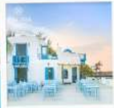
ซานตารีน่าคาเฟ่