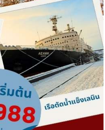
เรือตัดน้ำแข็งเลนิน