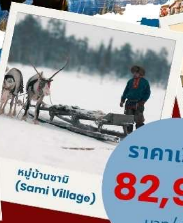
หมู่บ้านซามิ (Sami Village)