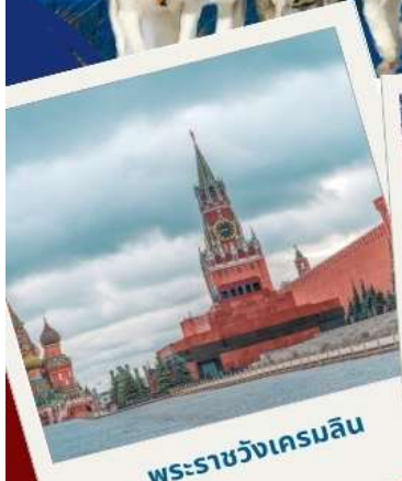
พระราชวังเครมลิน