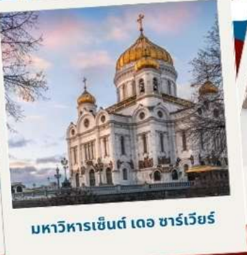
มหาวิหารเซนต์ เดอ ชาร์เวียร์