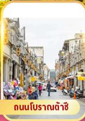
ถนนโบราณต้าชิ