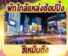
พักใกล้แหล่งช้อปปิ้ง ซีเหมินติง