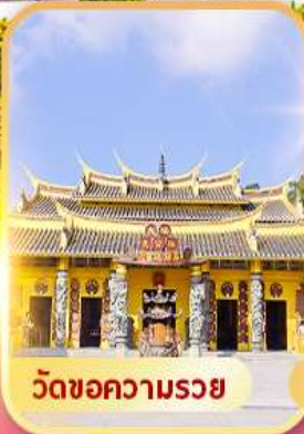
วัดขอความรอย