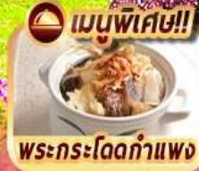
เมนูพิเศษ!! พระกระโดดกำแพง