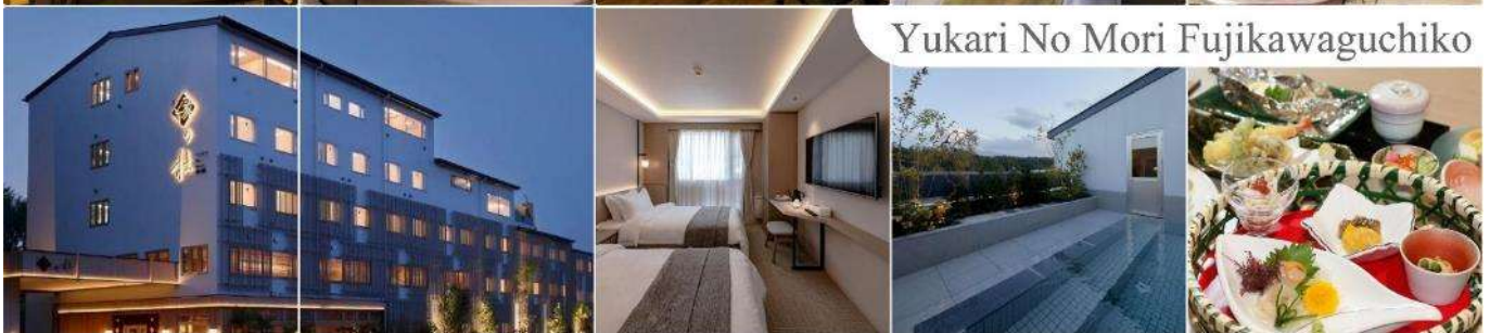
Yukari No Mori Fujikawaguchiko

วันที่ห้า เมืองยามานาชิ – สัมผัสหิมะ ณ ลานสกี ฟูจิเท็น สโนว รีสอร์ท – การเรียนพิธีชงชาญี่ปุ่น – กรุงโตเกียว – ชมแมวยักษ์ 3 มิติ พร้อมช้อปปิ้ง ย่านชินจูกุ – เมืองนาริตะ