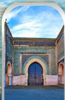
KASBAH OF MOULAY ISMAIL