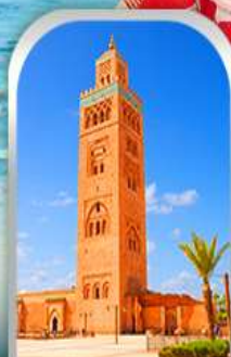
JEMAA EL-FNAA MARRAKESH