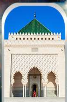
MOHAMMED V SQUARE