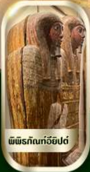
พีพีรภัณฑกรอียิปต์