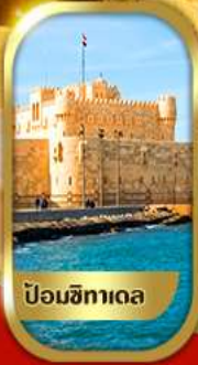
ป้อมปราการเดอ