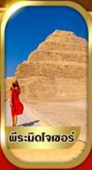
พีระมิดโจเซอร์