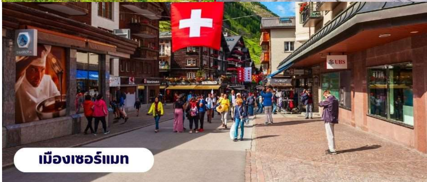
เมืองเซอร์แมท