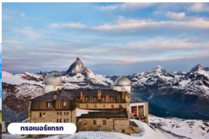
กรอเนอร์กรัท