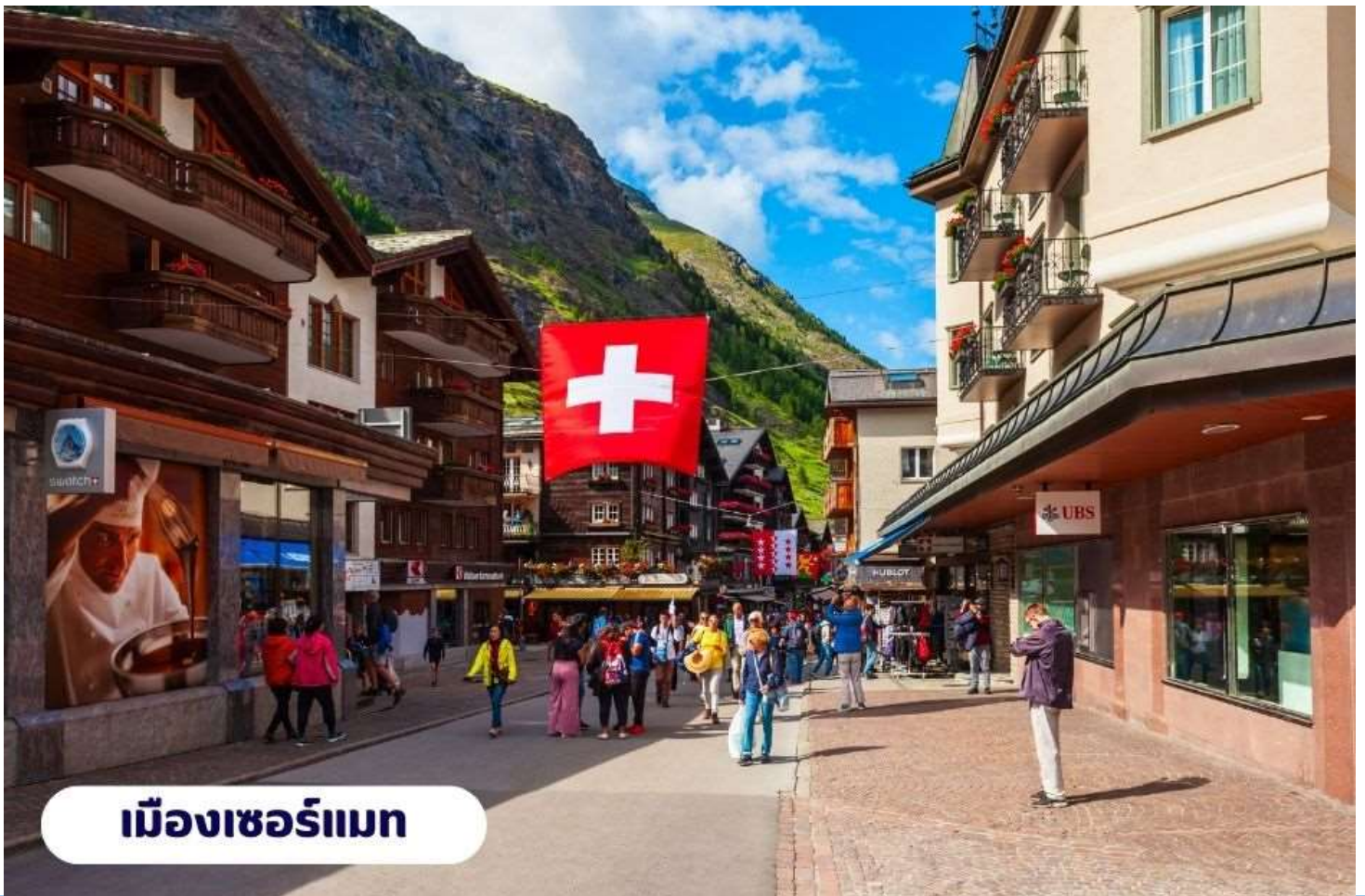
เมืองเซอร์แมท

📍 บริการอาหารเช้า ณ ห้องอาหารของโรงแรม จากนั้นนำท่านเดินทางสู่ เมืองแทสซ์ (Tasch) ใช้เวลาเดินทางประมาณ 2.30 ชั่วโมง ตั้งอยู่ในประเทศสวิตเซอร์แลนด์ เป็นประเทศขนาดเล็กที่ไม่มีทางออกสู่ทะเล และตั้งอยู่ในทวีปยุโรปตะวันตก ซึ่งมีเทือกเขาแอลป์ ซึ่งเป็นเทือกเขาที่ใหญ่ที่สุดของทวีปยุโรป เลาะเลียบบตามหุบเขา ชมทิวทัศน์สวยอันงดงาม ตลอดเส้นทาง จากนั้นนำท่านเดินทางโดยรถไฟสู่เมืองเซอร์แมท (Zermatt) ใช้เวลาเดินทางประมาณ 15 นาที โดยรถไฟซึ่งเป็นเมืองที่ไม่อนุญาตให้รถยนต์วิ่งและเป็นเมืองที่ได้รับการยกย่องว่า ปลอดภัยที่สุดในโลกตั้งอยู่บนความสูงกว่า 1,620 เมตร ซึ่ง เป็นที่ตั้งของยอดเขามัทเทอร์ฮอร์น ซึ่งเป็นสัญลักษณ์ของสวิตเซอร์แลนด์ เมืองเซอร์แมทเป็นเมืองเล็กๆ หรืออาจจะเรียกได้ว่าเป็นหมู่บ้านก็ได้ เพราะว่ามีประชากรในเมืองไม่ถึง 10,000 คน