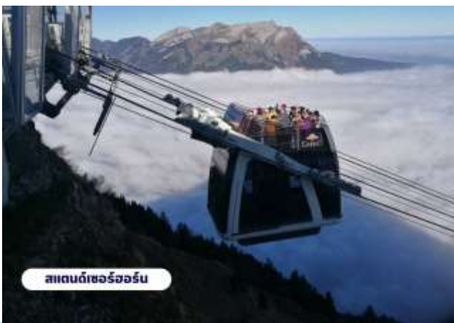
สแตนเซอร์ฮอร์น

🍷 บริการอาหารเช้า ณ ห้องอาหารของโรงแรม จากนั้นนำท่านเดินทางสู่สถานีกระเช้าเพื่อเตรียมตัวเดินทางขึ้นสู่ ยอดเขาสแตนเซอร์ฮอร์น (Mt.Stanserhorn) มีความสูงที่ 1,898 เมตร(6,227 ฟุต) ระหว่างทางคุณจะได้ชมวิวแบบพาโนรามาและให้ท่านได้สัมผัสการเดินทางโดยขึ้นกระเช้า “Cabrio” กระเช้าลอยฟ้าเปิดประทุนที่มี 2 ชั้นแห่งแรกของ