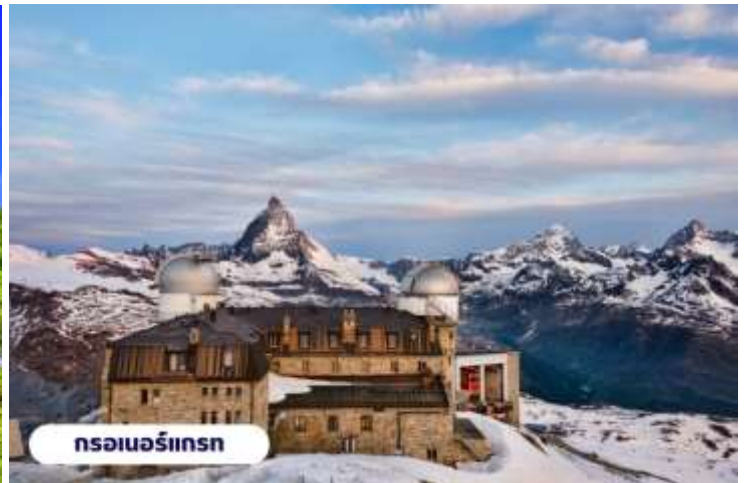
กรอเนอร์กรัท