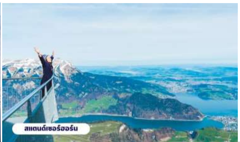
สแตนเซอร์ฮอร์น