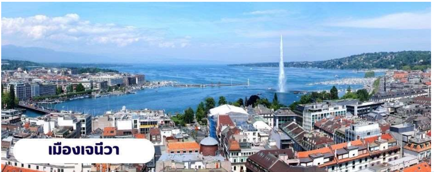
เมืองเจนีวา