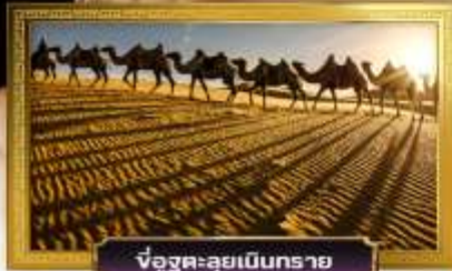
ขบวนคาราวาน