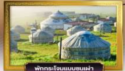
พักแรมแบบชนเผ่า

เดินทางโดย: สายการบินโซนาเซาเทิร์นแอร์ไลน์