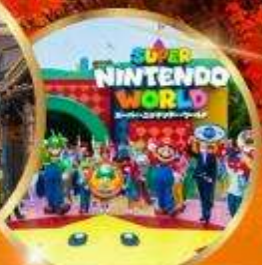
อิสระ: UNIVERSAL STUDIO