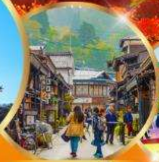
ทากายาม่า