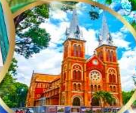
โบสถ์นอร์ทเธอดาม