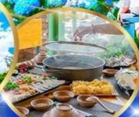
พิเศษ บุฟเฟ่ต์ 2 มื้อ