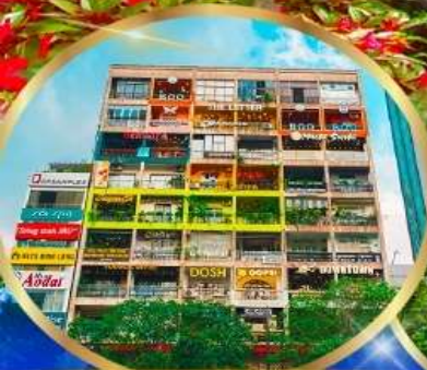
คาเฟ่ อพาร์ทเม้นท์