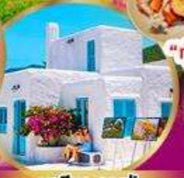
มารีนา คาเฟ่