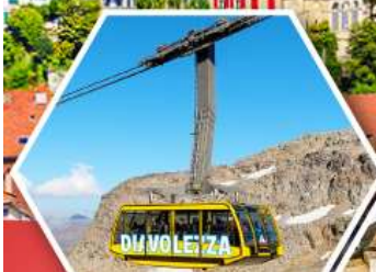
กระเช้าดิวาโอเลซซา