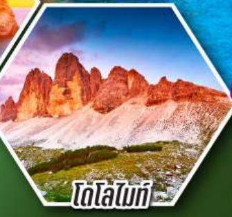
โตโลไมท์