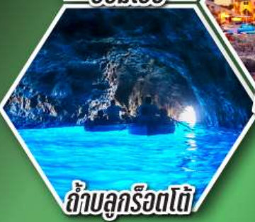
ถ้ำบลูริอตโต้