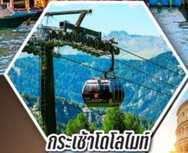
กระเช้าโดโลไมท์