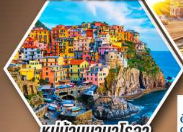
หมู่บ้านมานาโรลา