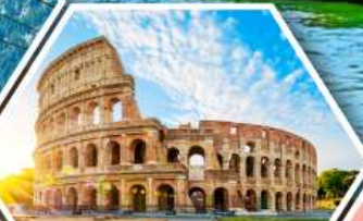
โคลอสเซียม