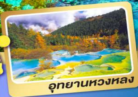
อุทยานหองหลง