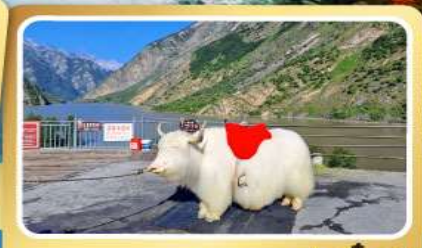
ทะเลสาปเตี้ยซี

• พัก 4-5 ดาว • ไม่ลงร้านช้อปปิ้ง • ชมโชว์ทิเบต • เมนูพิเศษ สุกี้หมาล่ารสอ่อน