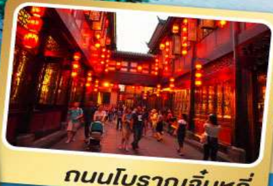
ถนนโบราณจิ้นหลี่