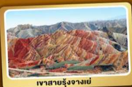
เขาสายรุ้งจางเย่