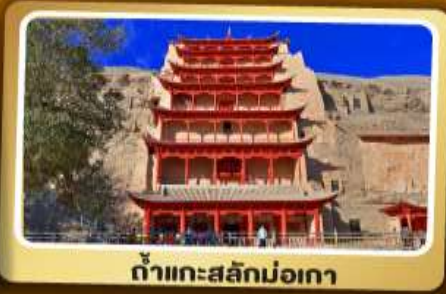
ถ้ำแกะสลักม่อเกา