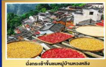
นั่งกระเช้าขึ้นชมหมู่บ้านหวงหลิง