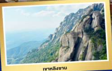
เขาลิงซาน