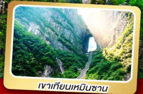
เวาเทียนเหมินชาน

ทริปเดียวเที่ยว 2 เมืองโบราณ ฝูหลงและเฟิ่งหวง ลิ้มรส สุกี้หัด ปิ้งย่างเกาหลี เปิดบักกิ้ง