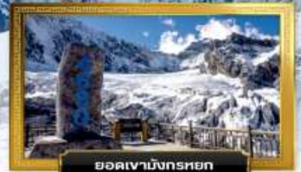
ยอดเขามังกรหยก