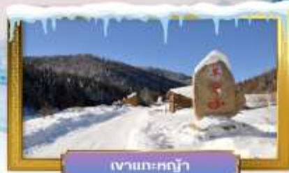
เจ้าแกะหิมะ