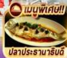
เมนูพิเศษ!! ปลาประรานาธิบดี