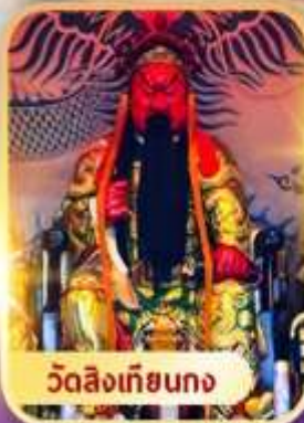
วัดลิ่งเกียนกง