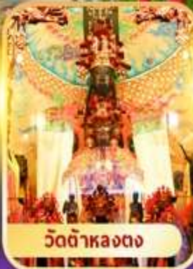
วัดต้าหลงตง