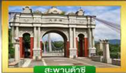
สะพานต้าซี