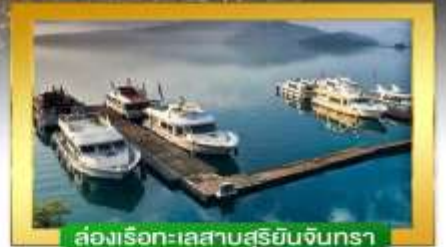
ล่องเรือทะเลสาบสุริยอันจินทรา