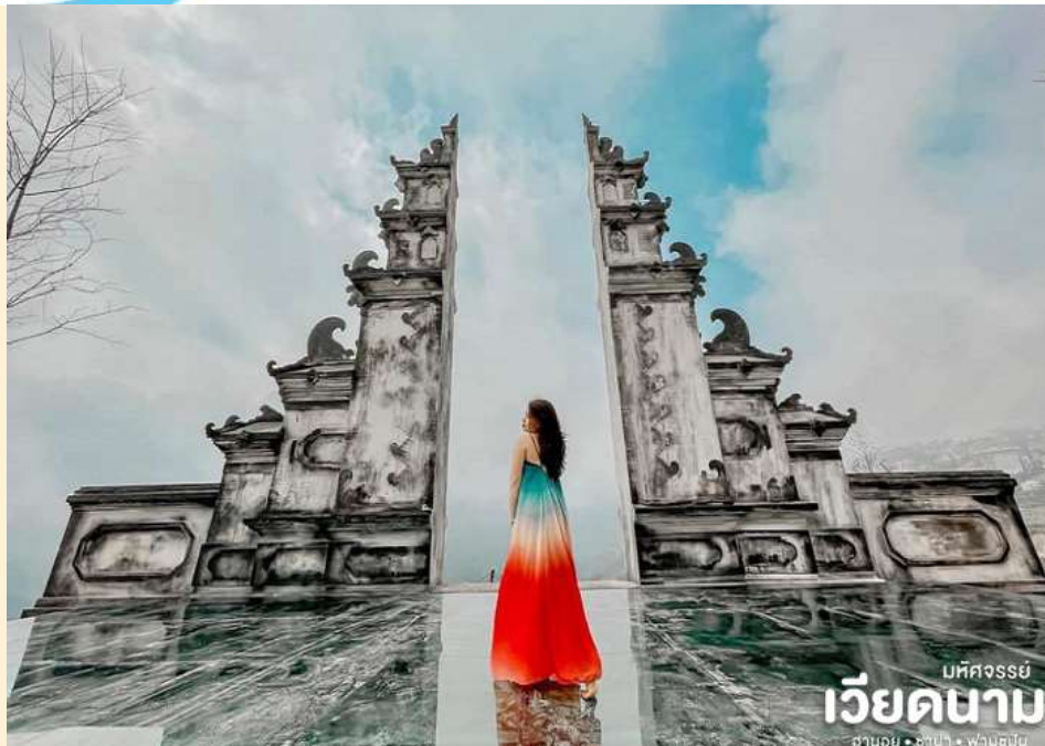
บึงจรรย์ เวียงจันทน์ ฮานอย • ซาปา • ฟานซิปัน