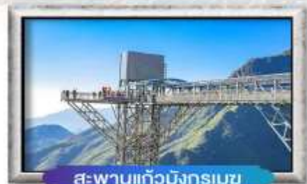
สะพานแก้วมิงกรเมซ