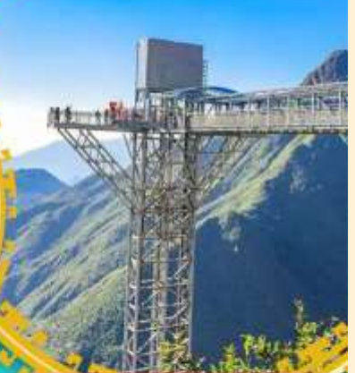
สะพานแก้วมิงกรเมซ

จุดเช็คอินแห่งใหม่เมืองฮานอย Mega Grand World