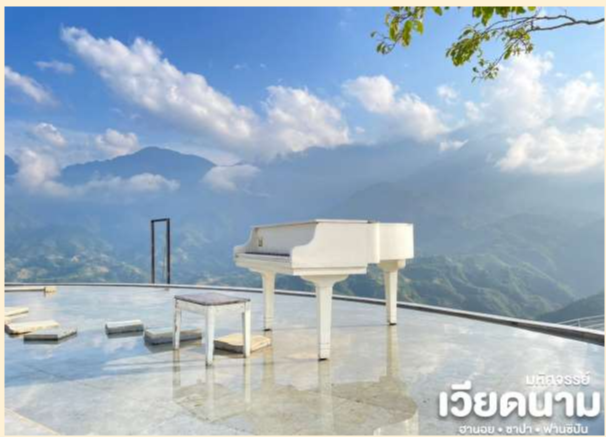
บึงจรรย์ เวียงจันทน์ ฮานอย • ซาปา • ฟานซิปัน