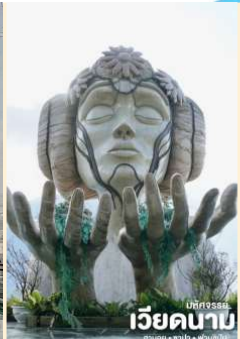
บึงจรรย์ เวียงจันทน์ ฮานอย • ซาปา • ฟานซิปัน