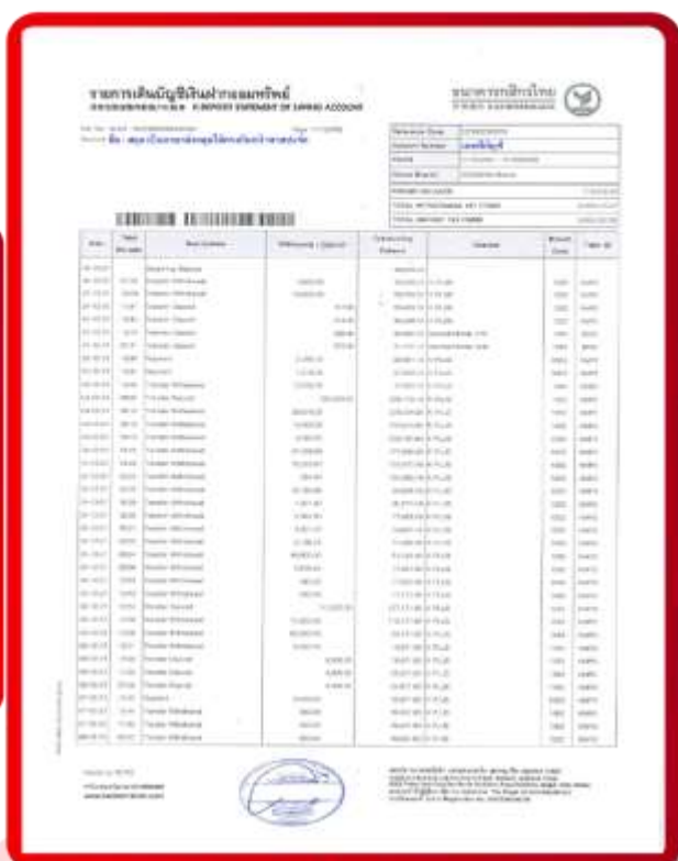
ตัวอย่าง Bank Statement ที่ผู้สมัครต้องขอจากธนาคาร

3.3 ปรับสมุดบัญชีธนาคารตัวจริง และเตรียมไปในวันที่ยื่นวีซ่า