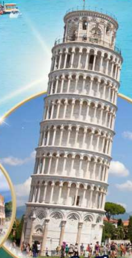
หอนเมืองปซา