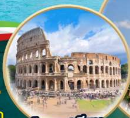
โคลอสเซียม