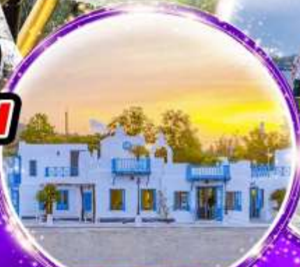
SON TRA MARINA