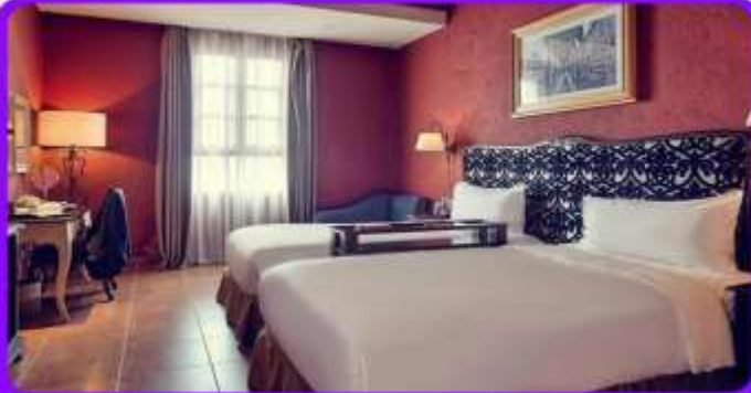
พักบนบานาฮิลล์ 1 คืน