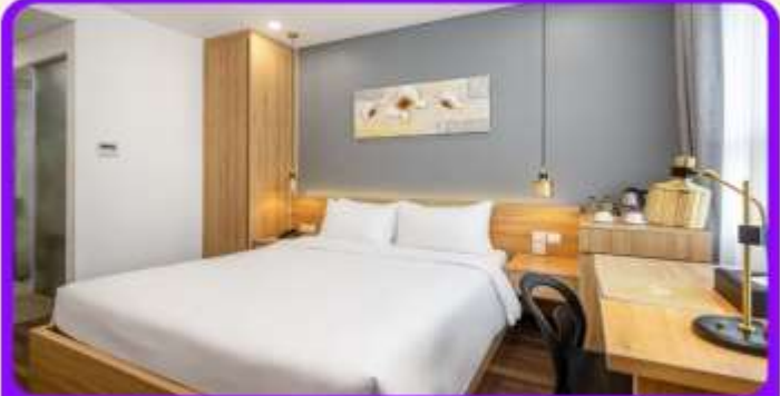
พักเมืองดานัง 4 ดาว 2 คืน