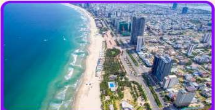
เช็คอิน ชายหาดหมีเคว เป็นชายหาดที่สวยงามที่สุดในเมืองดานัง