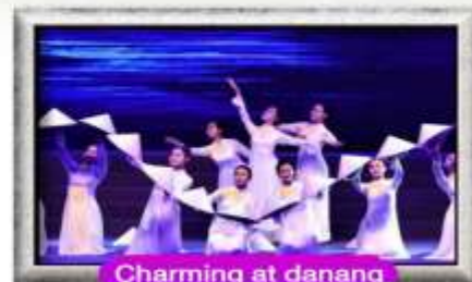
Charming at danang