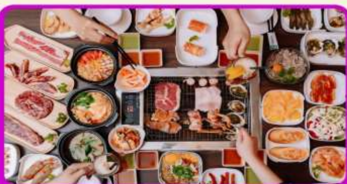
พิเศษ!! เมบูซาซิมิ+บุฟเฟ่ต์ปังย่าง