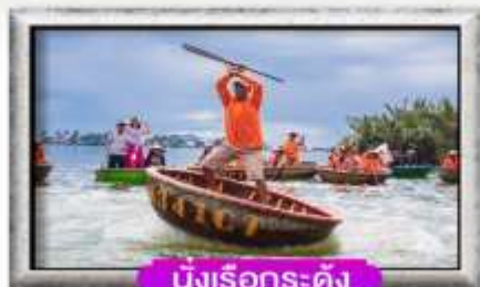
นั่งเรือกระดิง