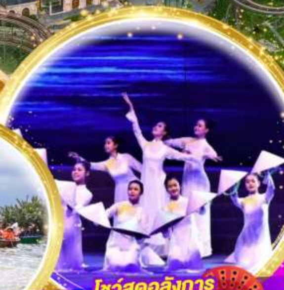
โชว์สุดอลังการ Charming at danang