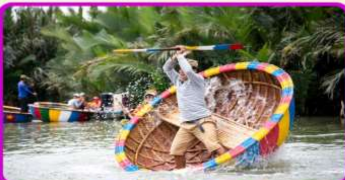
พิเศษ !!! นั่งเรือกระด้ง UNSEEN เวียดนาม