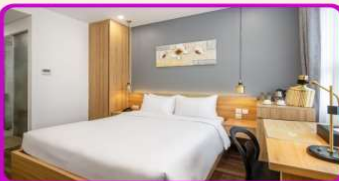
พักเมืองดานัง 4 ดาว 2 คืน