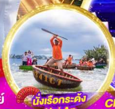
นั่งเรือกระด้ง Hoi An