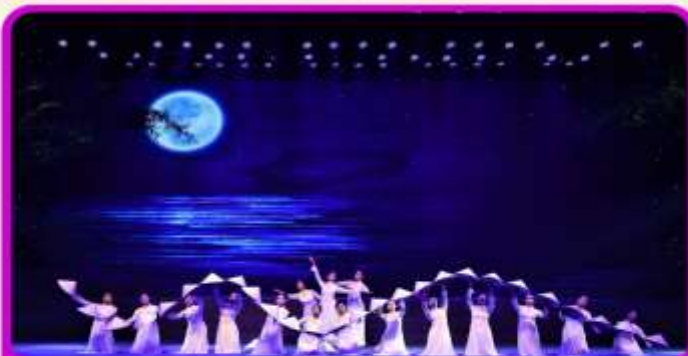
ชมการแสดง Charming Show Danang