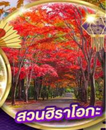
สวนอิระโอกะ