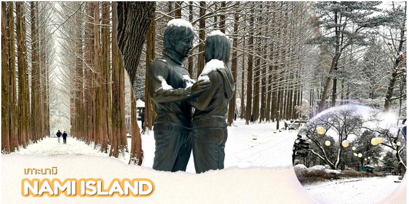
เกาะนามิ NAMI ISLAND

จากนั้นออกเดินทางสู่ เมืองซุนซน ตั้งอยู่ในจังหวัดคังวอนโด ผู้คนยังคงวิถีชีวิตแบบบ้านๆซึ่งจะแตกต่างจากกรุงโซลเมืองหลวงของเกาหลีที่เต็มไปด้วยแสงสีเสียงหลายคนถ้าได้ยินชื่อเมืองซุนซนคงไม่รู้จักและไม่รู้ว่าอยู่ส่วนไหนของเกาหลีแต่ถ้าบอกว่าเกาะนามิทุกคนก็คงร้องออกมาว่าอ้ออย่างแน่นอน นำท่านเดินทางสู่ เกาะนามิ นั่งเรือเฟอร์รี่ข้ามไปโดยใช้เวลาประมาณ 10 นาที เกาะนามิ แหล่งท่องเที่ยวที่มีชื่อเสียงของเกาหลีใต้ที่สามารถท่องเที่ยวได้ทั้งปี ตั้งอยู่กลางทะเลสาบชองเพียง บนเกาะจะมีบรรยากาศร่มรื่นเต็มไปด้วยต้นสน ต้นเกาลัด ต้นแปะก๊วย ต้นซากุระ ต้นเมเปิ้ล และต้นไม้ดอกไม้อื่นๆที่ผลัดกันออกดอกเปลี่ยนสีให้ชมกันทุกฤดูกาล บรรยากาศหนาวๆ มีหิมะปกคลุมก็จะอยู่ในช่วงเดือนธันวาคม-มกราคม เกาะนามิโด่งดังจาก ซีรีส์เรื่อง Winter Love song โดยใช้เกาะนามิเป็นสถานที่ถ่ายทำ มีคู่รักมากมายมักไม่พลาดที่จะมาถ่ายรูปกับจุดไฮไลต์บนเกาะสุดโรแมนติก Winter Sonata's First Kiss รูปปั้นคู่พระ-นาง จากซีรีส์เรื่องดัง ไกลกันนั้นยังมีโซนอาหารทั้งร้านอาหารแบบนั่งทาน ร้านปิ้งย่าง และซาลาเปาหนึ่งเตาถ่านแบบโบราณ