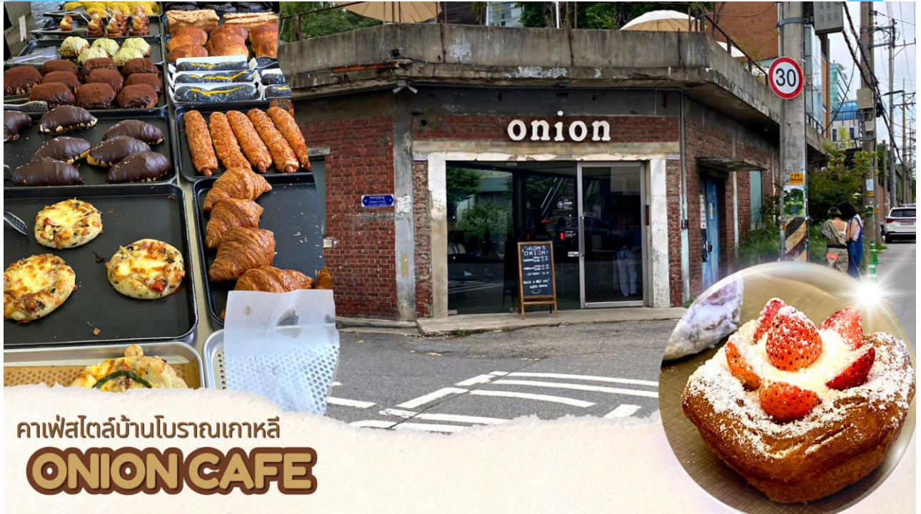
คาเฟ่สไตล์บ้านโบราณเกาหลี ONION CAFE

อิสระช้อปปิ้งย่าน ฮงแด HONGDAE อยู่ใกล้กับมหาวิทยาลัยศิลปะ สงอีกที่มีชื่อเสียงมากของเกาหลีบรรยากาศจึงสดใสเต็มไปด้วยหนุ่มสาวชาวโซลในตอนกลางวันฮงแดเป็นถนนที่สามารถเดินช้อปปิ้งในร้านเสื้อผ้าสวยสุดอาร์ตแบบราคานักศึกษา และอัปเดตสตรีท สไต์ล จากแฟชั่นนิสต้าตัวจริงส่วนกลางคืนเป็นแหล่งปาร์ตี้ที่ chic