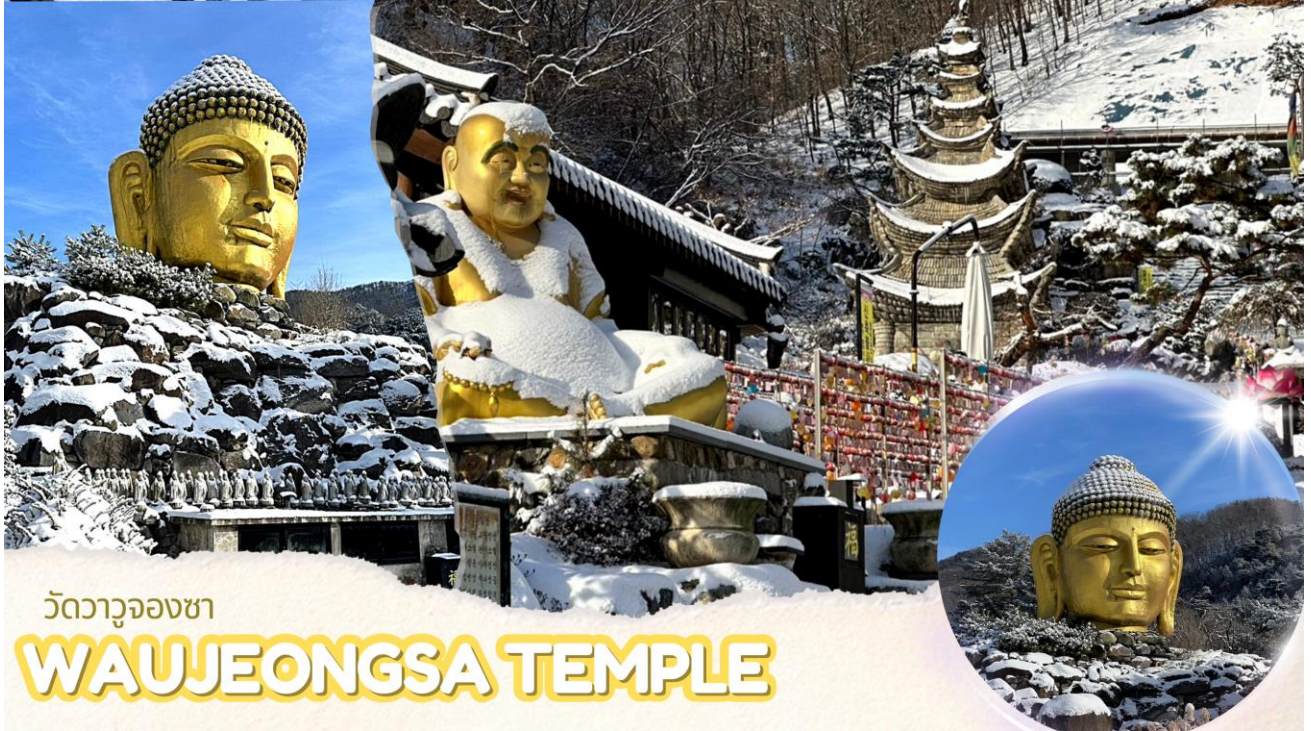
วัดวาจวองซา WAUJEONGSA TEMPLE

นำท่านไป วัดวาจวองซา (Waujeongsa Temple) ตั้งอยู่ในเมืองยงอิน จังหวัดคยองกีโด เป็นวัดเก่าแก่ที่ตั้งอยู่กลางภูเขา มีเศียรพระพุทธรูปเจ้าขนาดใหญ่สีทองอร่ามดูโดดเด่น ซึ่งเป็นสัญลักษณ์ที่สำคัญของวัดนี้ เศียรพระพุทธรูปนี้มีความสูงถึง 8 เมตร วางตั้งอยู่บนกองหินขนาดใหญ่ วัดแห่งนี้สร้างขึ้นในปี ค.ศ. 1970 โดยนักบวชเสด็จออกเพื่อแสดงการตอบแทนความเมตตากรุณาของพระพุทธรูปเจ้าในการรวมประเทศเกาหลีเหนือและเกาหลีใต้