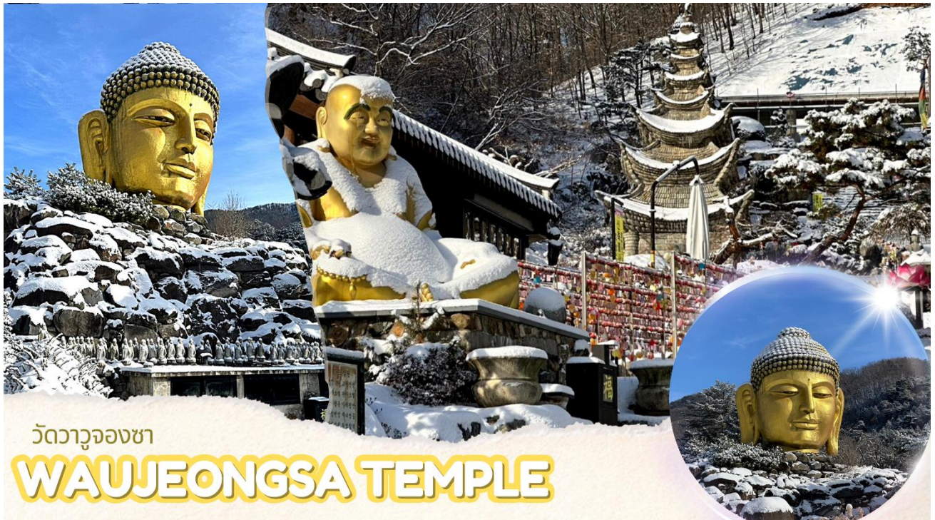
วัดวาจูจงซา

นำท่านไป วัดวาจูจงซา (Waujeongsa Temple) ตั้งอยู่ในเมืองยงอิน จังหวัดคยองกีโด เป็นวัดเก่าแก่ที่ตั้งอยู่กลางภูเขา มีเศียรพระพุทธรูปเจ้าขนาดใหญ่สีทองอร่ามดูโดดเด่น ซึ่งเป็นสัญลักษณ์ที่สำคัญของวัดนี้ เศียรพระพุทธรูปนี้มีความสูงถึง 8 เมตร วางตั้งอยู่บนกองหินขนาดใหญ่ วัดแห่งนี้สร้างขึ้นในปี ค.ศ. 1970 โดยนักบวชเสด็จออกเพื่อแสดงการตอบแทนความเมตตากรุณาของพระพุทธรูปเจ้าในการรวมประเทศเกาหลีเหนือและเกาหลีใต้