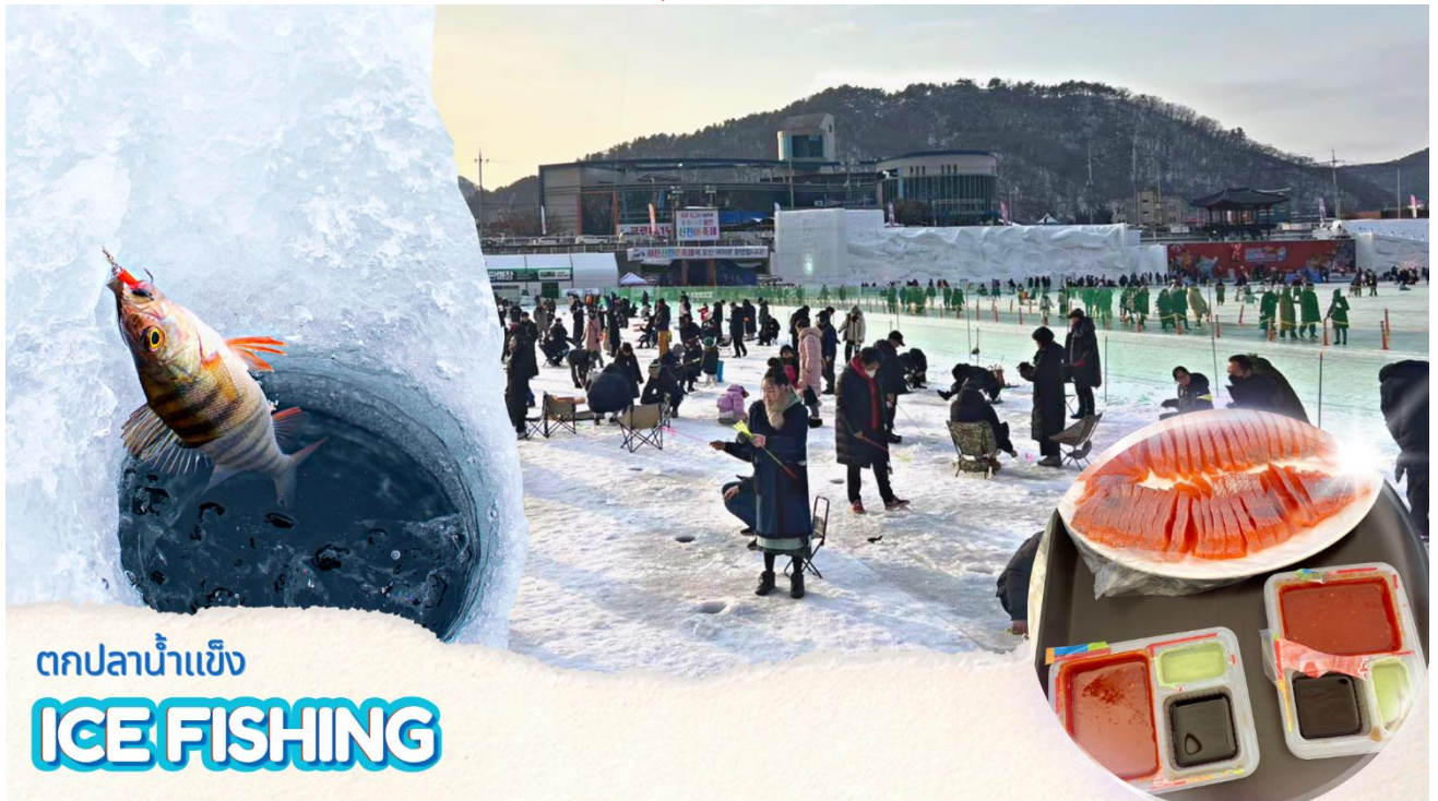
ตกปลาน้ำแข็ง ICE FISHING

(**รวมอุปกรณ์ตกปลาแบบเบสิค**) วิธีการตกปลา คือ หย่อนเหยื่อปลอม (ที่ทางเทศกาลเตรียมไว้ให้) ลงไปในรู จากนั้นก็กระตุกไม้เบ็ดตกปลาเบาๆ ให้เหมือนเหยื่อกำลังลอยไปลอยมาในน้ำ และปลาก็จะเข้ามากินเหยื่อ ง่ายๆ เพียงแค่นี้ก็ทำให้ท่านตกปลาได้อย่างสนุกสนาน )