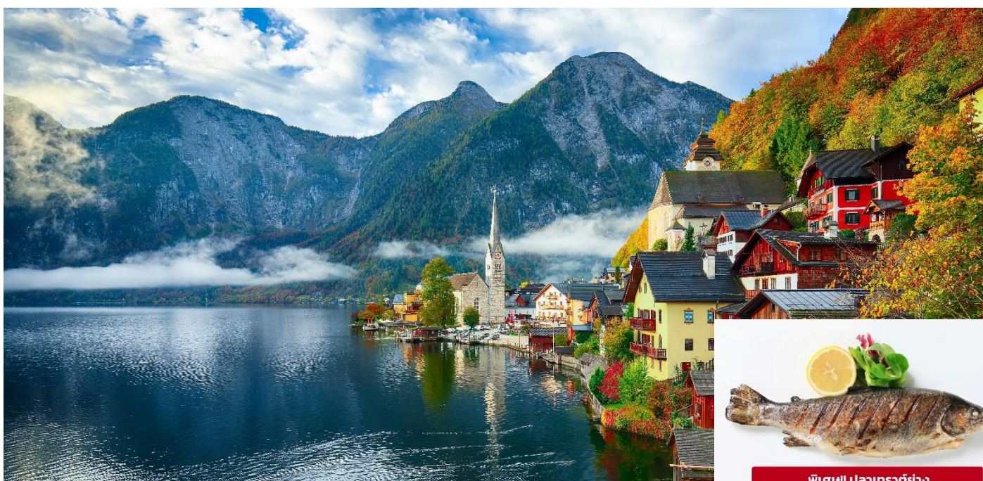
พิเศษ!! ปลาเทราต์ย่าง

นำทุกท่านเดินทางไปเที่ยวชมที่ เมืองอัลส์สตัดท์ (Hallstatt) (ระยะทาง 290 กม./ 4.30 ชม.) เป็นหนึ่งในหมู่บ้านริมทะเลสาบที่สวยงามที่สุดในโลก อีกทั้งบรรยากาศและความเงียบสงบเหมาะแก่การมาพักผ่อนหย่อนใจให้ท่านอิสระเดินถ่ายภาพเที่ยวชมวิถีชีวิตของคนในหมู่บ้านตามอัธยาศัย