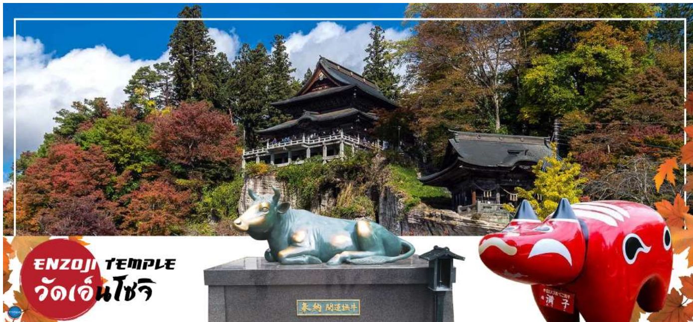
ENZOJI TEMPLE วัดเอ็นโซจิ

เดินทางสู่ เมืองยูโนะคามิ ออนเซน (ใช้เวลาเดินทางประมาณ 1 ชั่วโมง) เป็นเมืองตากอากาศออนเซนเล็กๆ ที่มีชื่อเสียงของจังหวัดฟุกุชิมะ