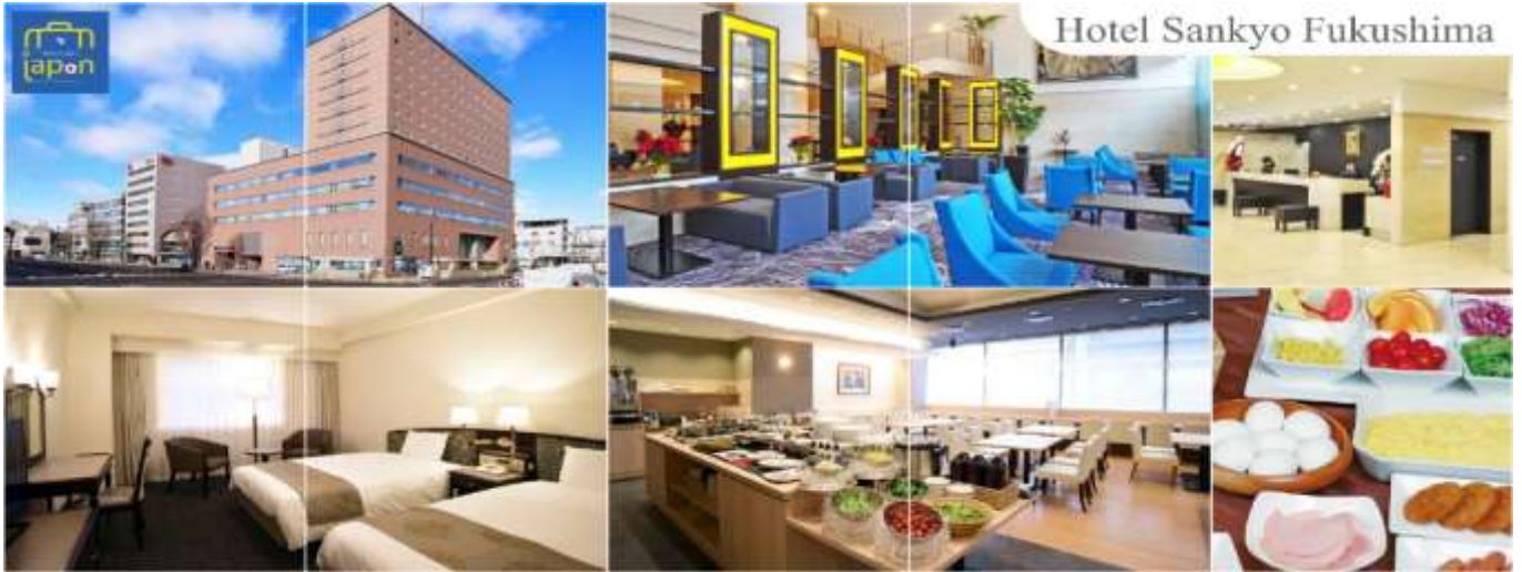
Hotel Sankyo Fukushima

พักที่ HOTEL SANKYO FUKUSHIMA หรือเทียบเท่าระดับเดียวกัน