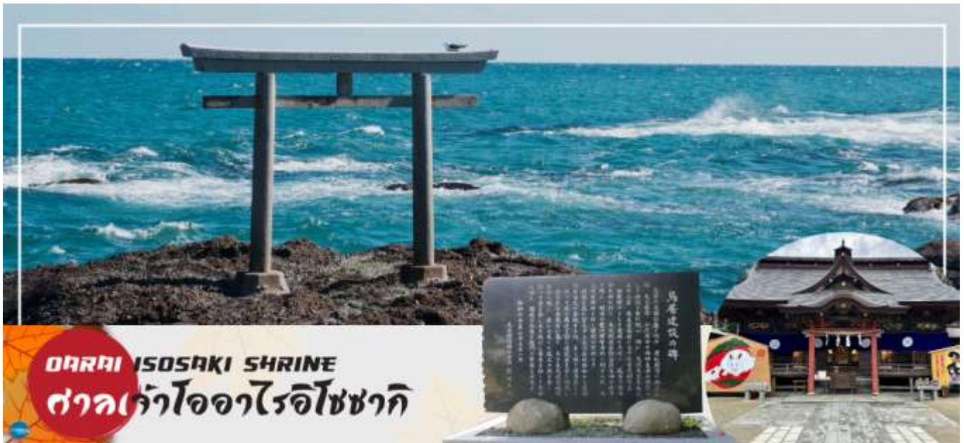
OARAI ISOSAKI SHRINE ศาลเจ้าโออาไรอิโซซากิ

เดินทางสู่ ศาลเจ้าโออาไรอิโซซากิ (Oarai Isosaki Shrine) ศาลเจ้าที่มีประวัติศาสตร์ยาวนาน ตั้งอยู่บนเนินเขาหันหน้าสู่มหาสมุทรแปซิฟิก เป็นหนึ่งในเสาโทริอิขนาดใหญ่ที่มีชื่อเสียงในภูมิภาคคันโต ถูกเลือกให้เป็นทรัพย์สินทางวัฒนธรรมแห่งจังหวัด และได้รับความเชื่อถือมาอย่างยาวนานในฐานะเทพเจ้าผู้ให้ความคุ้มครองการคมนาคมทางทะเล และความสงบสุขภายในครอบครัว นำท่านรับพลังงานบวก ณ เสาโทริแห่งคามิอิโซะ (Kamiiso no Torii) โทริอิสี่เสาที่นึ่งสงบ บนโขดหินท่ามกลางฟองคลื่นสีขาวที่สาดกระเซ็น ซึ่งเป็นที่ประดิษฐานของเทพเจ้าโอนามิจิโนะมิโคโตะ และเทพเจ้าสุคะเนฮิโกะโนะมิโคโตะ สร้างขึ้นตั้งแต่ 29 ธันวาคม ค.ศ.856 รวมทั้งยังเป็นจุดถ่ายรูปพระอาทิตย์ขึ้นที่มีชื่อเสียง มีนักท่องเที่ยวมากมายมาเฝ้าคอยเพื่อเก็บภาพช่วงเวลาที่แสงตะวันสาดส่องขึ้นสู่ขอบฟ้า