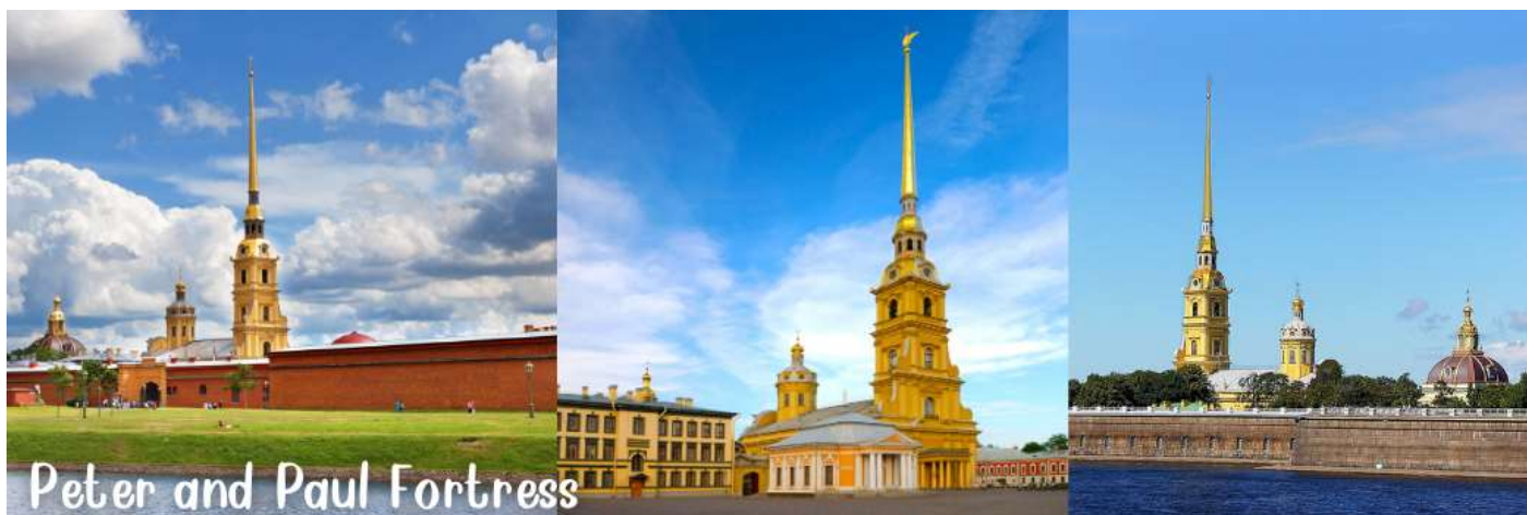
Peter and Paul Fortress

นำท่านชม ป้อมปีเตอร์ แอนด์ ปอลด์ (Peter And Paul) เป็นสิ่งก่อสร้างแรกสุดของเมือง St Petersburg สร้างในปีค.ศ 1703 เป็นอนุสรณ์ชัยชนะสงครามเหนือสวีเดน ด้วยศิลปะแบบบารอกเพื่อใช้เป็นป้อมปราการในการป้องกันข้าศึกกรุกราน ตั้งอยู่บน เกาะวาซิลเยฟสกี (Vasilievsky Island) ลักษณะเป็นรูปทรงหกเหลี่ยม กำแพงเป็นหินก่ออิฐ ส่วนวิหารปีเตอร์ แอนด์ ปอลด์ (Peter-and-Paul-Fortress) เริ่มสร้างขึ้นเมื่อปีค.ศ 1712 ด้วยการ ออกแบบของ DomennicaTrezzini สร้างเสร็จในวันที่ 29 มิถุนายน ค.ศ 1733 ตั้งชื่อวิหารแห่งนี้เพื่อเป็นเกียรติแด่นักบุญปีเตอร์ และนักบุญปอลด์เพื่อเป็นการเผยแพร่ศาสนา ความสูงของยอดแหลมคือ 122.5 เมตร ในอดีตเป็นสิ่ง ก่อสร้างที่สูงที่สุดของเมืองและห้ามสร้างสิ่งก่อสร้างใดสูงกว่า ภายในทำการตกแต่งด้วยศิลปะบารอกซึ่งนับว่าแตกต่าง กับโบสถ์คริสต์ออร์ทอดอกซ์ทั่วไปและวิหารแห่งนี้ยังเป็นที่เก็บศพของราชวงศ์โรมานอฟ เริ่มต้นจากพระเจ้าปีเตอร์มหาราชเป็นองค์แรก จนกระทั่งถึงกษัตริย์องค์สุดท้ายของราชวงศ์