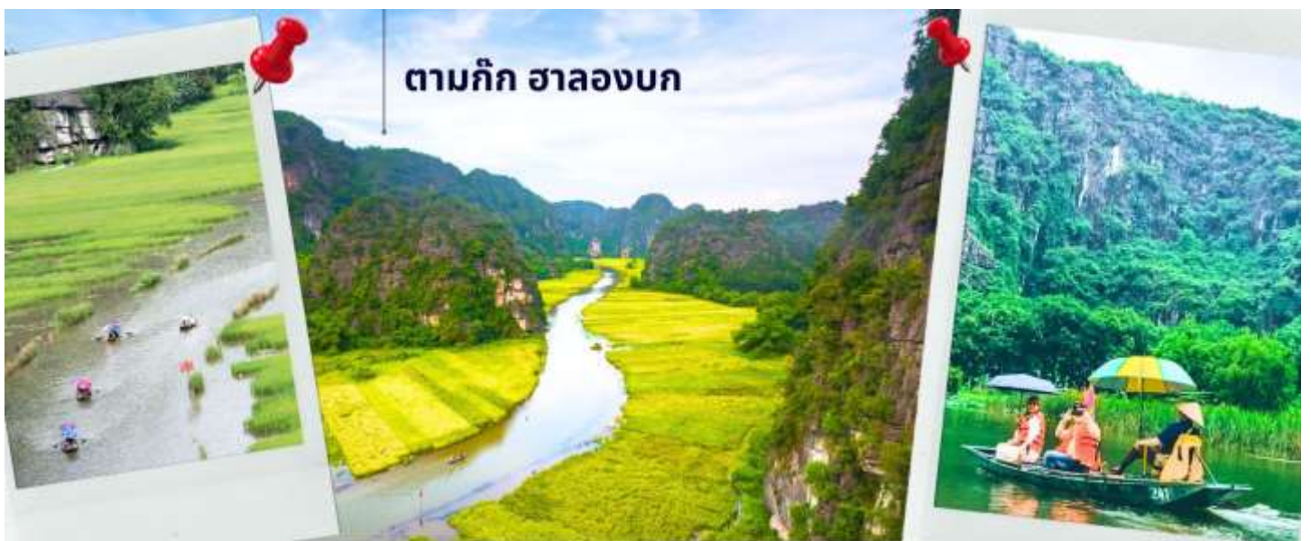
ตามก๊ก ฮาลองบก

จากนั้นนำท่านเดินทางสู่ ตามก๊ก เป็นพื้นที่ที่มีทิวทัศน์อันงดงามของยอดเขาหินปูน แม่น้ำหลายสายไหลลัดเลาะ บางส่วนจมอยู่ใต้น้ำ และยังถูกล้อมรอบด้วยผาสูงชัน จึงทำให้สถานที่แห่งหนึ่งงดงามน่าชม การขึ้นชมทัศนียภาพที่สวยงามในจ่างอานนั้น คือการล่องเรือเล็กประมาณลำละ 4-5 คนเพื่อเข้าไปเยี่ยมชมจ่างอาน เรือแจวก็จะพาเราไปเยี่ยมชมวัด หลังจากนั้นก็จะพาเราไปลอดถ้ำ มีทั้งหมด 49 ถ้ำ ซึ่งแต่ละถ้ำจะมีชื่อแตกต่างกันไปจะใช้เวลาล่องเรือไปกลับร่วมสองชั่วโมงเลย ที่เดียว จ่างอานยังถูกเรียกว่า ฮาลองบก เพราะที่นี่มีเขาหินปูนและถ้ำคล้ายกับที่อ่าวฮาลอง