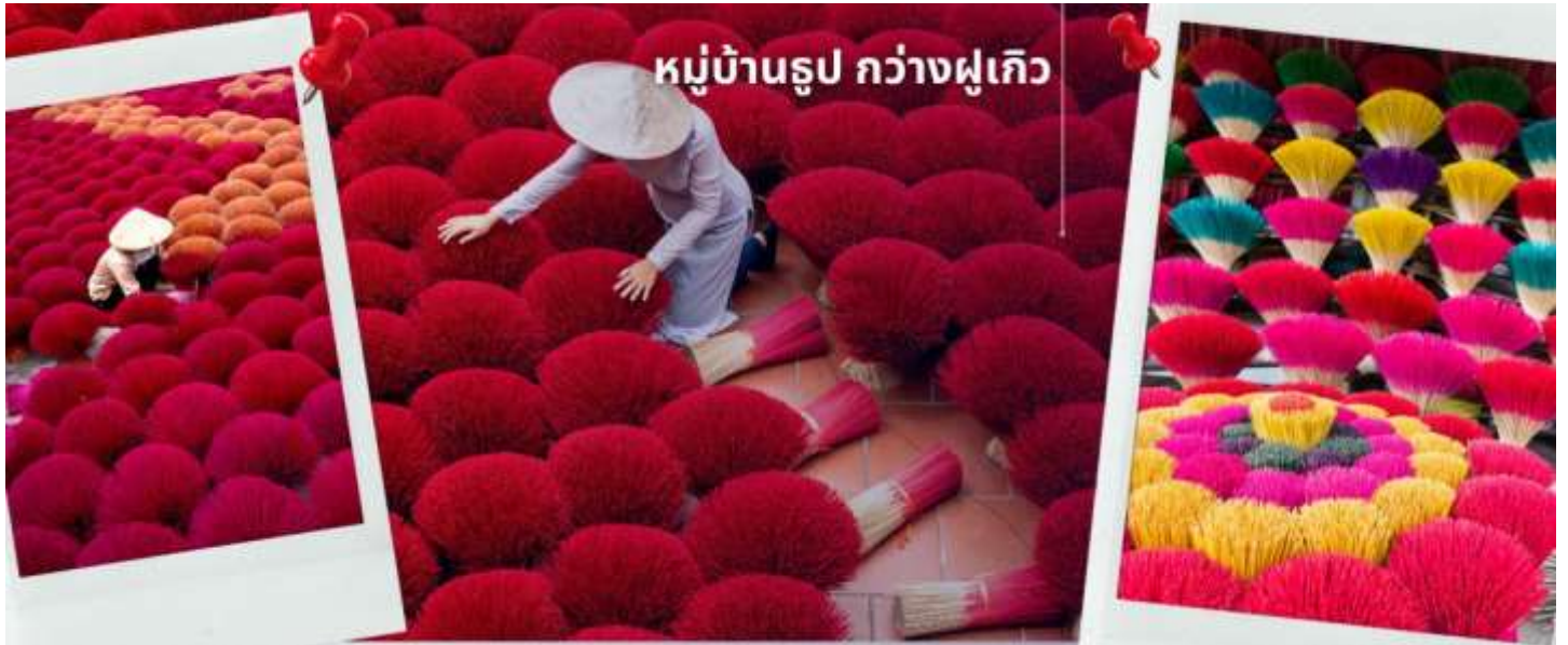
หมู่บ้านรูป กว้างฝูเกิว

จากนั้นนำท่านเดินทางสู่เมืองนิงห์บิงก์ แวะเที่ยวชมวิถีของชาวเวียดนามใน หมู่บ้านรูป หมู่บ้านชุมชนที่เป็นแหล่งผลิตรูปที่ใหญ่ที่สุดแห่งหนึ่งของประเทศเวียดนาม หมู่บ้านกว้างฝูเกิว หมู่บ้านรูป เอกลักษณะเหมือนทุ่งดอกไม้ใกล้กรุงฮานอย ชาวบ้านที่ส่งต่อ และถ่ายทอดวิธีการทำรูปแบบดั้งเดิม ทั้งการเหลาไม้ไผ่