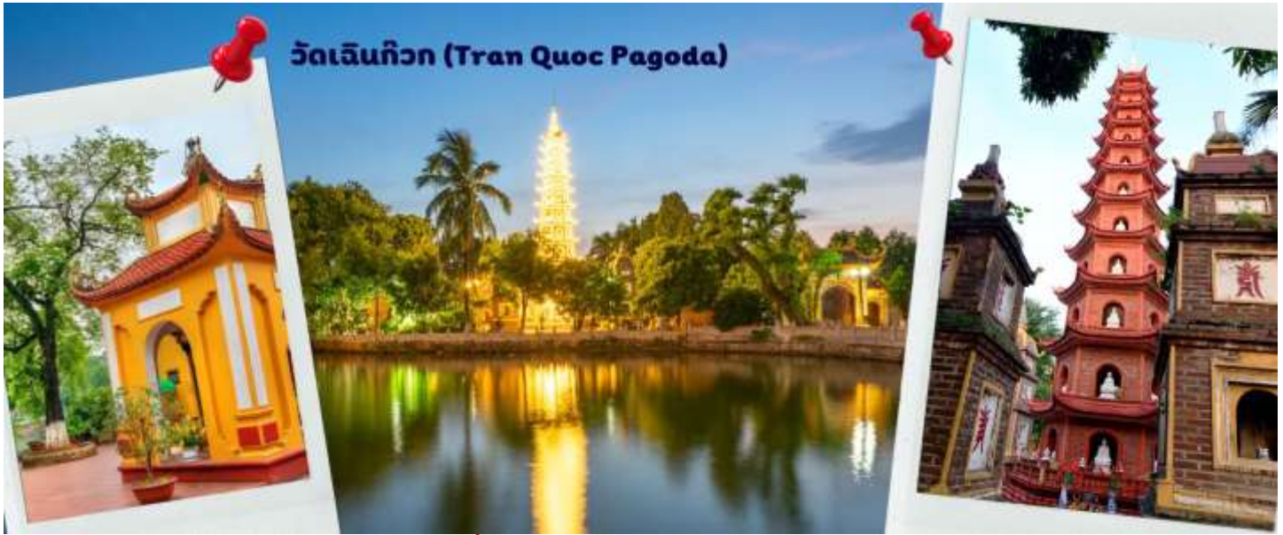
วัดเจตินก๊วก (Tran Quoc Pagoda)

จากนั้นให้ท่านได้ อิสระช้อปปิ้ง ถนนสาย 36 street แหล่งช้อปปิ้งของฮานอย มีต้นไม้ปกคลุมสองฝั่งถนน สาเหตุที่ชื่อถนน 36 มาจาก 36 อาชีพที่ทำการค้าขายบนถนนแห่งนี้ ตั้งแต่อดีตอย่างงานด้านหัตถกรรมสอดคล้องกับชื่อถนนแต่ปะเส้น ไนอดีตอย่าง เครื่องเงิน ผ้าไหม บนถนนแห่งนี้ แต่ปัจจุบันมากกว่า 36 ไปแล้ว ที่นี่จะเป็นแหล่ง Shopping มีสินค้าเกือบทุกชนิด ร้านขายชุดกีฬาทุกแบรนด์เพราะที่นี่เป็นแหล่งผลิตให้หลาย ๆ แบรนด์