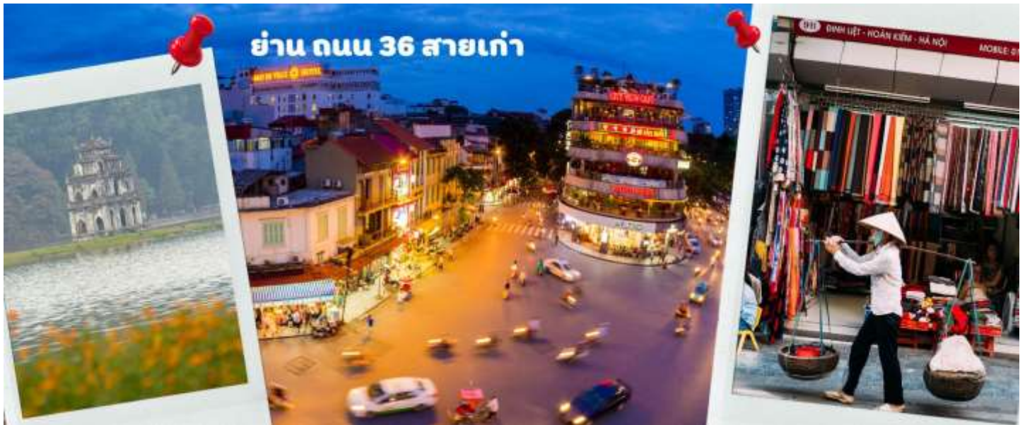
ย่าน ถนน 36 สายเก่า

จากนั้นให้ท่านได้ อิสระช้อปปิ้ง ถนนสาย 36 street แหล่งช้อปปิ้งของฮานอย มีต้นไม้ปกคลุมสองฝั่งถนน สาเหตุที่ชื่อถนน 36 มาจาก 36 อาชีพที่ทำการค้าขายบนถนนแห่งนี้ ตั้งแต่อดีตอย่างงานด้านหัตถกรรมสอดคล้องกับชื่อถนนแต่ปะเส้น ไนอดีตอย่าง เครื่องเงิน ผ้าไหม บนถนนแห่งนี้ แต่ปัจจุบันมากกว่า 36 ไปแล้ว ที่นี่จะเป็นแหล่ง Shopping มีสินค้าเกือบทุกชนิด ร้านขายชุดกีฬาทุกแบรนด์เพราะที่นี่เป็นแหล่งผลิตให้หลาย ๆ แบรนด์