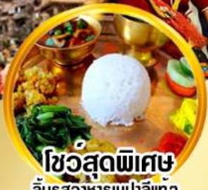
ไขว้สุดพิเศษ ลิ้มรสอาหารเนปาลแท้

ดินแดนศักดิ์สิทธิ์กลางห้อมกอดหิมาล้น สัมผัสสถาปัตยกรรมอันวิจิตรงดงาม กาฐมาณฑุ โภครา ภัคตาบูร์ ปาทัน นากาก็อต