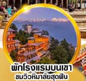
พักโรงแรมเนปาล ชมวิถีหิมาล้นสุดฟิน

21-25 มิ.ย. / 19-23 ก.ค. / 9-13 ส.ค. / 13-17 ก.ย.