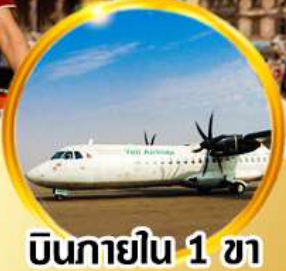
บินภายใน 1 ชม