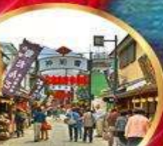
ย่านโบราณ ชิบูย่า

34,919 ราคาเริ่มต้น บาท รวมภาษีมูลค่าเพิ่ม 7%