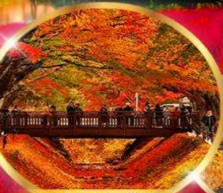
อุโมงค์เมเปิ้ล