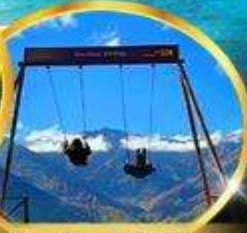
Yoo hoo! Swing