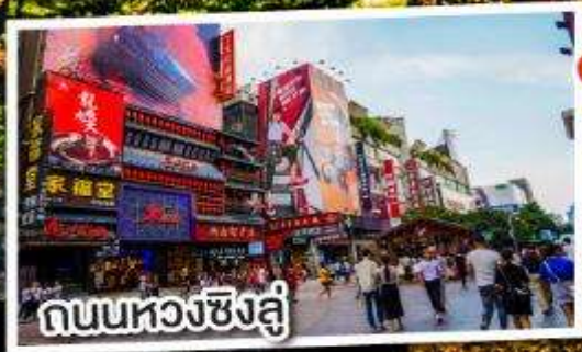
ถนนหวงซิงฉู่