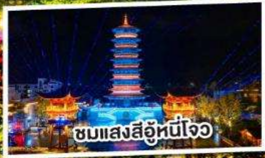
ชมแสงสีอุโมงค์ใจ