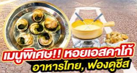
เมนูพิเศษ!! หอยเอสคาโก้ อาหารไทย, ฟองดูซีส