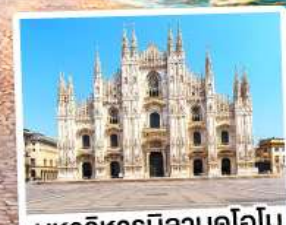
มหาวิหารมิลานดูโอโม