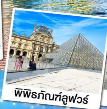
พิพิธภัณฑ์ลูฟวร์