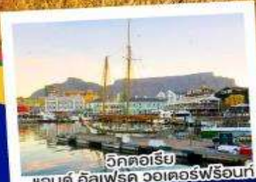
วิกตอเรีย แอนดรูว์ ฮัลเฟรด วอเตอร์พรีออนท์