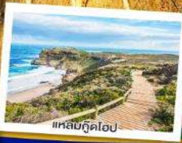
แหลมกู๊ดโฮป