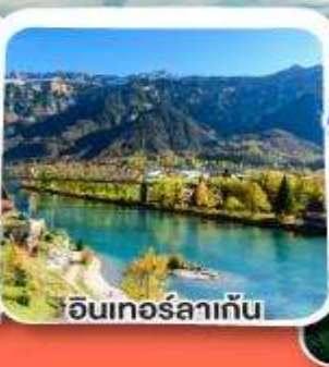
อินเทอร์ลาเก้น