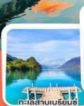
ทะเลสาบเบรียนซ์