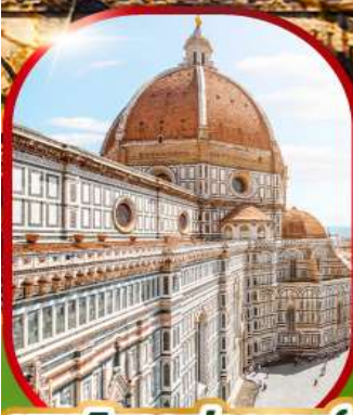
มหาวิหารฟลอเรนซ์