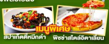
เมนูพิเศษ สปาเก็ตตี้หมักค่ำ พิชซ่าสไตล์อิตาลี