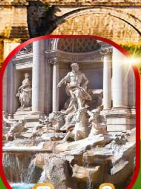
น้ำพุทรวี่