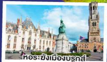
หอระฆังเมืองบรูจส์