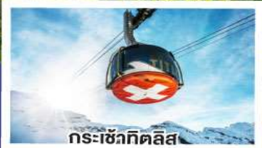
กระเช้าคีตลิส