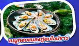
เมนูหอยแมลงภู่อบไวน์ขาว