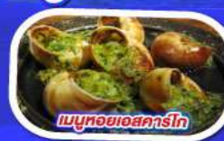
เมนูหอยแอสคาร์โก

ทานอาหาร ณ ภัตตาคารบนหอไอเฟล พร้อมชมวิวแสนโรแมนติก เมนูหอยแมลงภู่อบไวน์ขาว