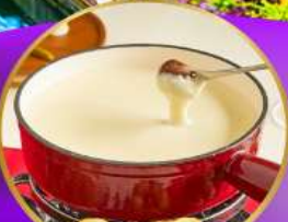
ฟองดูซีส