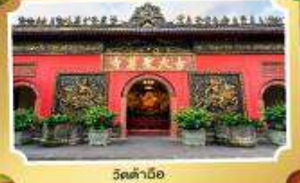
วัดต้ามื่อ