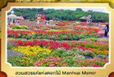
สวนสวรรค์แห่งดอกไม้ Manhua Manor