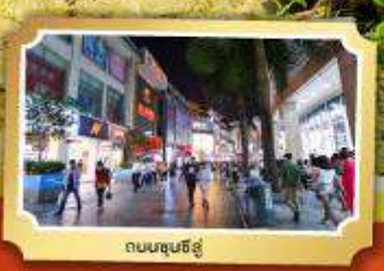
ถนนชุนชิว