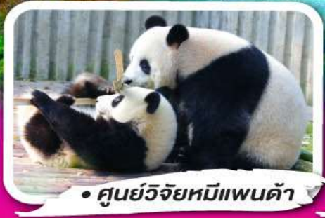
• ศูนย์วิจัยหมีแพนด้า