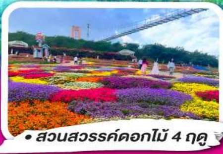
• สวนสวรรค์ดอกไม้ 4 ฤดู