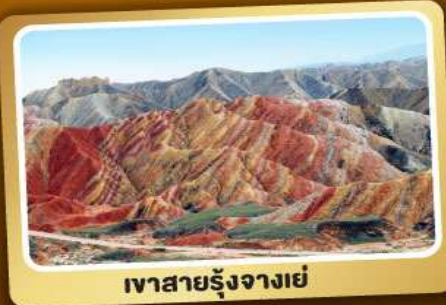
เขาสายรุ้งจางเย่