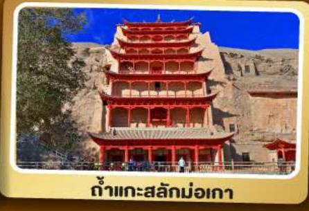
ถ้ำแกะสลักม่อเกา