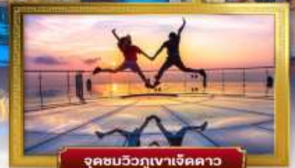
จุดชมวิวกูเงาเจ็ดดาว