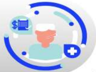
กรณีเจ็บป่วย:

กรณีเจ็บป่วยจนไม่สามารถเดินทางได้ ต้องมีใบรับรองแพทย์จากโรงพยาบาล บริษัทฯ จะทำการเลื่อนการเดินทางของท่านไปยังคณะต่อไป ทั้งนี้ ท่านจะต้องเสียค่าใช้จ่ายที่ไม่สามารถยกเลิก หรือเลื่อนการเดินทางได้ตามความเป็นจริง