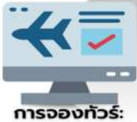
การจองทัวร์: